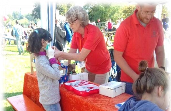
„Kindern eine Stimme geben“ beim diesjährigen Weltkindertag am Seepark in Freiburg