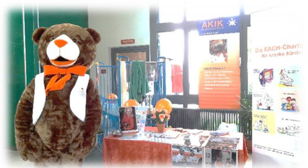
AKIK Stand beim 20. bundesweiter Tag des Kinderkrankenhauses 2017