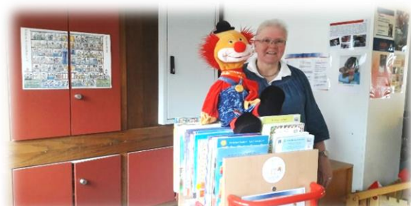
AKIK Bücherei im St. Elisabethen-Krankenhaus Lörrach