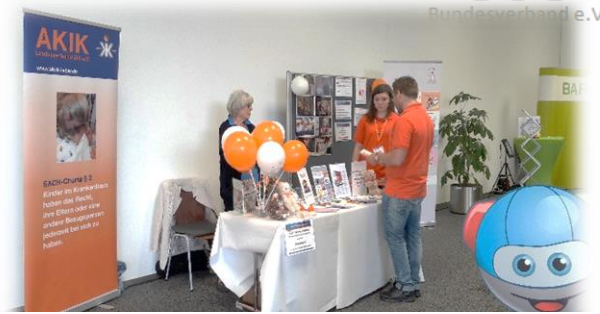
Einladung des Klinikums Mittelbaden Baden-Baden Balg zum sechsten Baby- und Kindertag im Mercedes-Benz-Kundencenter Rastatt