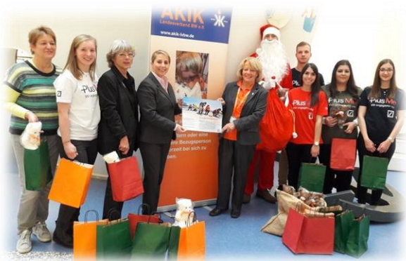
Spende der Deutschen Bank AG - 400 Rettungsteddys® für das Olghospital Stuttgart