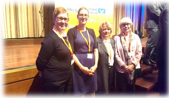
Anlässlich des 125-jährigen Bestehens der Volksbank Baden-Baden / Rastatt eG beim Benefiz Neujahrskonzert im Kurhaus Baden-Baden